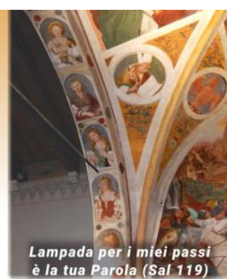
Lampada per i miei passi è la tua Parola (Sal 119)