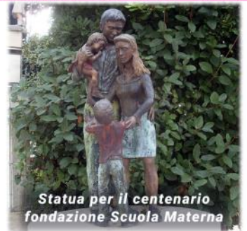
Statua per il centenario fondazione Scuola Materna