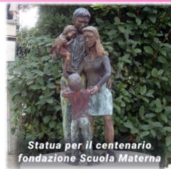
Statua per il centenario fondazione Scuola Materna