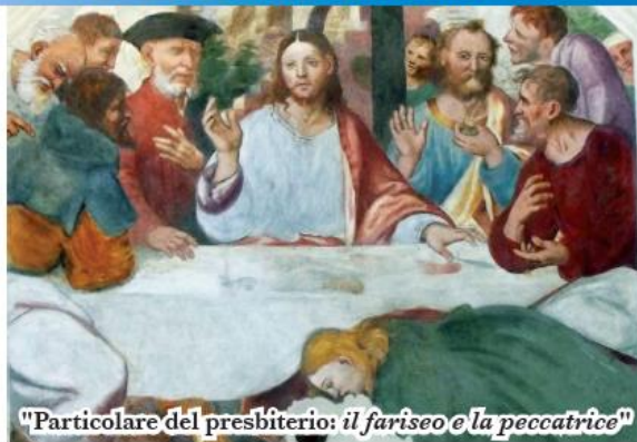
"Particolare del presbitero: il fariseo e la peccatrice"