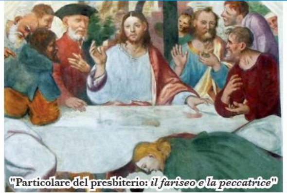
"Particolare del presbiterio: il fariseo e la peccatrice"