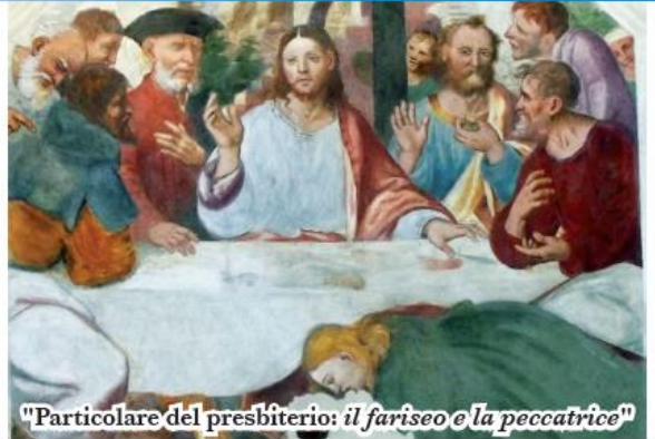
"Particolare del presbiterio: il fariseo e la peccatrice"