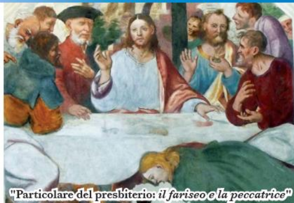
"Particolare del presbiterio: il fariseo e la peccatrice"