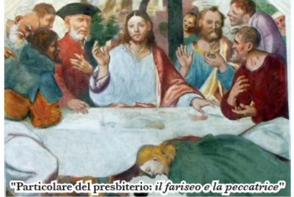
"Particolare del presbiterio: il fariseo e la peccatrice"