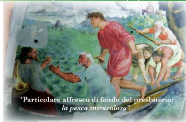
"Particolare affresco di fondo del presbiterio: la pesca miracolosa"