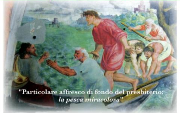
"Particolare affresco di fondo del presbiterio: la pesca miracolosa"