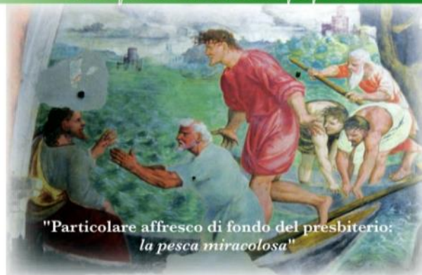
"Particolare affresco di fondo del presbiterio: la pesca miracolosa"