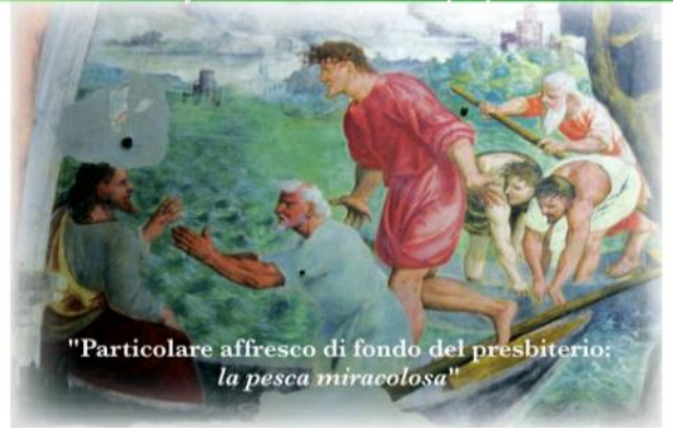
"Particolare affresco di fondo del presbiterio: la pesca miracolosa"