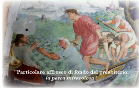
"Particolare affresco di fondo del presbiterio: la pesca miracolosa"