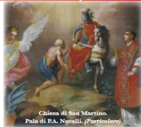
Chiesa di San Martino. Pala di P.A. Novelli. (Particolare)