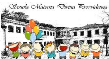
Scuola Materna Donna Dorrendenza